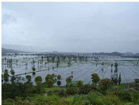
Inundaciones de la Laguna en 2006

Instaurada la República, el general Simón Bolívar realizó varias concesiones para la explotación de las riquezas naturales de la Gran Colombia. Es así como en 1826, le otorga al empresario José Ignacio París Ricaurte la propiedad de la laguna siempre y cuando desarrollara en ella labores de desecamiento. Como esta labor no se llevó a cabo, la laguna continuó bajo propiedad del Estado hasta 1846, año en el cual, por decreto presidencial, el general Tomás Cipriano de Mosquera la entrega como recompensa prestada a sus servicios a la independencia del país a los generales Valerio Barriga, Pedro Alcántara Herrán, Francisco Urdaneta y Joaquín París Ricaurte.